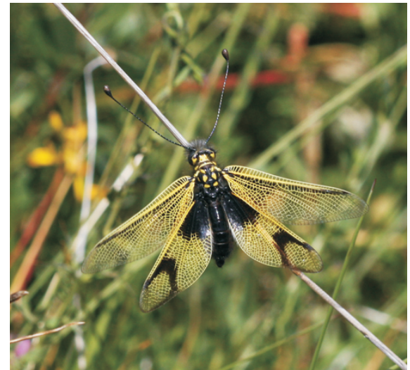
Ascalaphus longicornis , un raro insecto cazador que se pode atopar neste espazo.

Desde a Ponte cruzamos o lugar e o río Xares e seguimos o camiño que leva ao Fial (indicado). Podemos desviarnos polo sendeiro balizado, un pouco máis curto, pero con máis pendentes, ou seguir a pista que chega ao cume. Desde o alto do Fial hai vistas panorámicas da lagoa, logo para baixar hai unha forte pendente de aproximadamente 700 m. Esta ruta pode facerse travesía ata Porto de Sanabria, polo val do Bibei (9 km máis); seguir pola lagoa de Ocelo, A Morteira e Xares e volver á Ponte (13 km máis), ou baixar, con moita dificultade e co camiño sen indicar, ata o val do Xares e volver seguindo río abaixo (7 km máis).