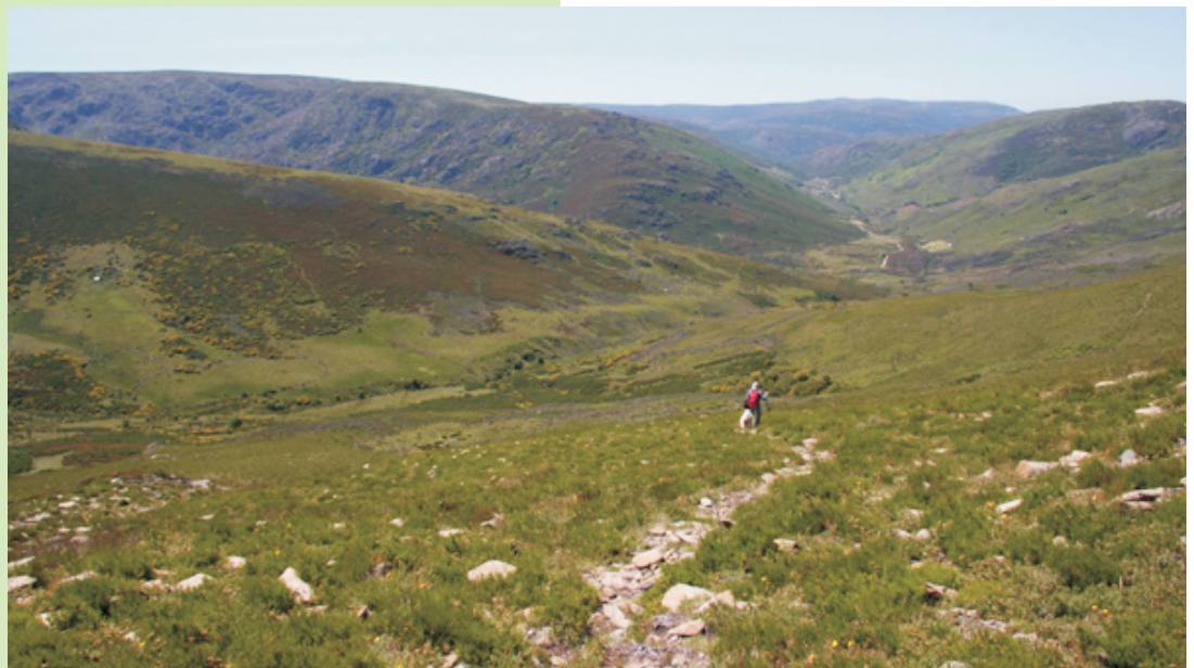
Baixando do Fial cara á lagoa. De fronte o val do Bibei.