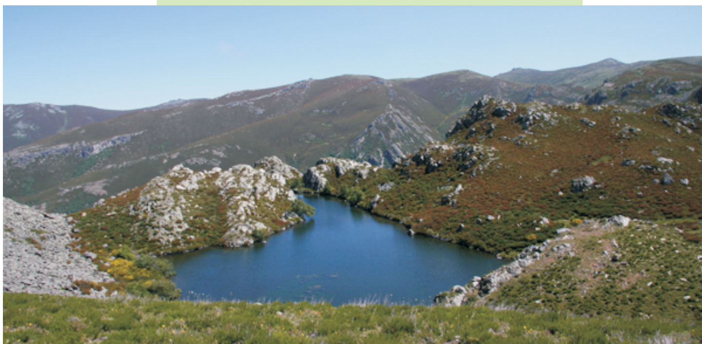
Lagoa da Serpe