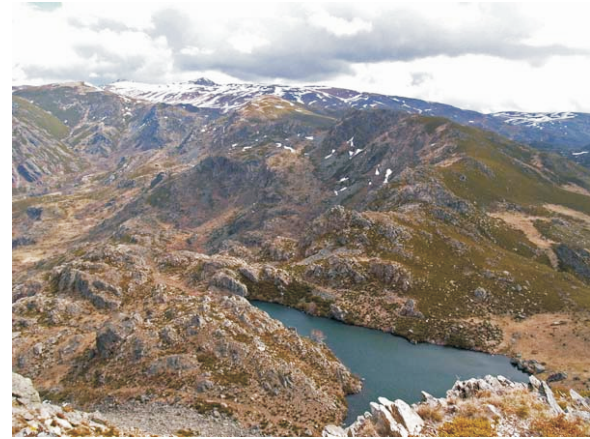
Lagoa da Serpe e Trevinca no inverno

Unha camiñada para achegarse á Lagoa da Serpe gozando de amplas panorámicas da serra do Eixe, o val glacial do Xares, aos pés de Trevinca, a serra Calva e o val glacial do Bibei.