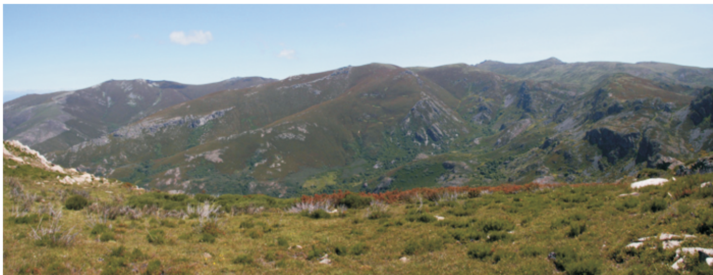
Val do Bibei coa serra do Eixe (Maluro e Trevinca)